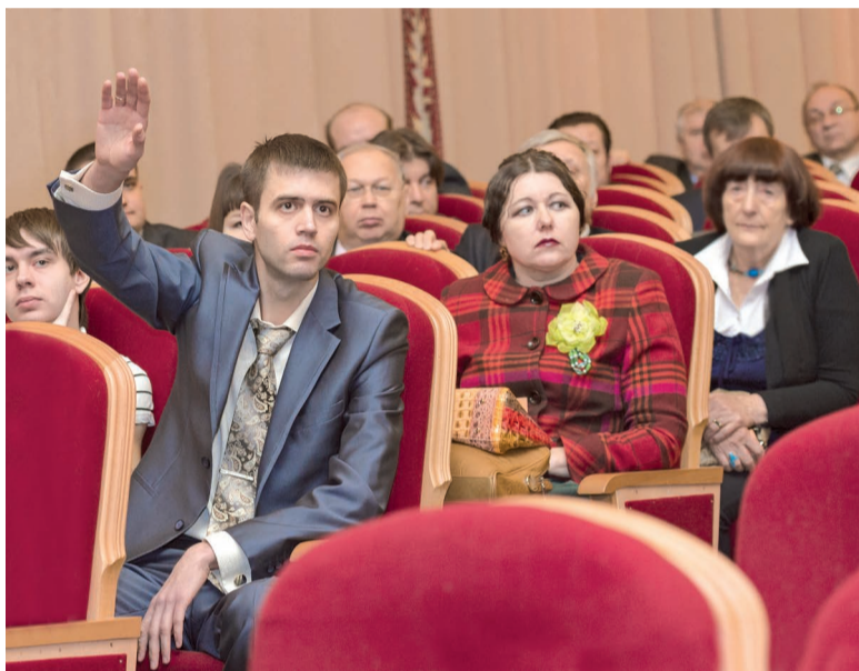
Высказаться по актуальному вопросу хотели многие сотрудники и студенты вуза.

По должности в состав совета вошли ректор, президент, проректоры и деканы факультетов. Общее число членов нового Учёного совета составляет 52 человека.