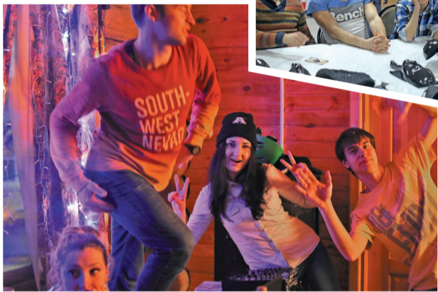
В зимние холода жизнь в «Политехнике» кипела.

По доброй традиции в конце января, когда сессия уже позади, студенты СамГТУ выбирают на природу. В этом году зимний заезд студентов в СОЛ «Политехник» продолжался до 6 февраля.