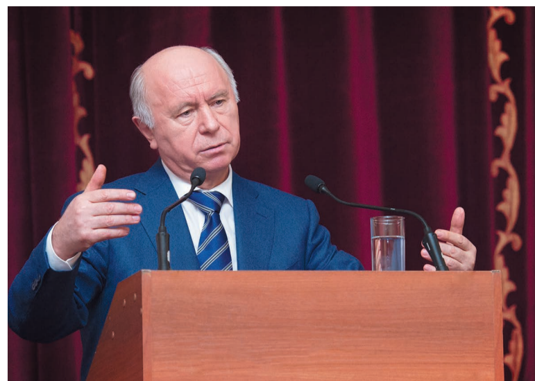
Губернатор предложил обсудить проект сообща.

«СГАУ вошел в топ-14 российских вузов. Если произойдет объединение, СамГТУ присоединится к СГАУ или это будет новая организация?» – прозвучал из зала ещё один вопрос. «Это будет новое объединение. Хотелось бы сохранить имя академика Сергея Королёва в его